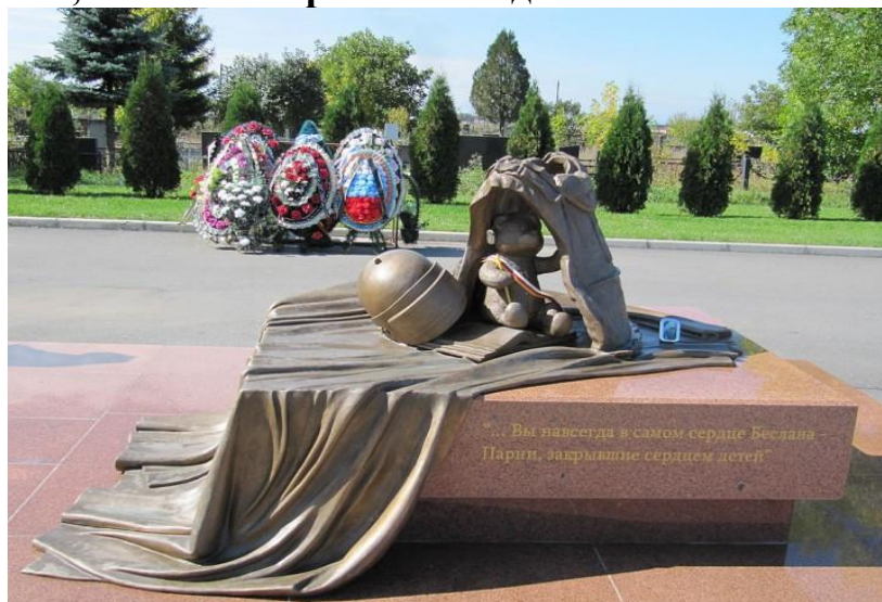
Памятник бойцам спецназа, погибшим при штурме бесланской школы № 1